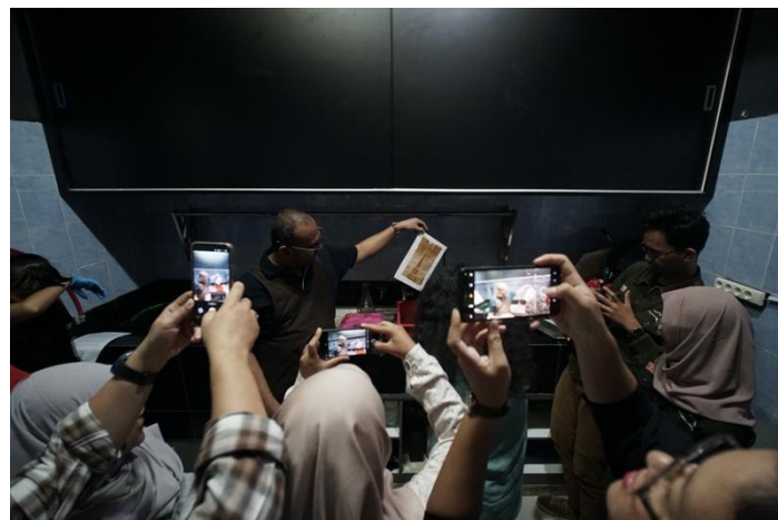
Gambar 4: Pengangkatan hasil albumen print yang sudah melalui proses toning menggunakan gold chloride . (Dokumentasi penelitian)

Tahap selanjutnya adalah penyensitisasian, yaitu proses melapisi kertas dengan larutan silver nitrate yang bereaksi dengan garam dalam albumen untuk membentuk silver chloride , senyawa peka cahaya yang menjadi inti proses pencetakan. Penyensitisasian dapat dilakukan dengan metode kuas atau perendaman, dan untuk beberapa eksperimen dapat ditambahkan potassium dichromate guna mengontrol kontras gambar. Setelah kertas sensitisasi siap, dilakukan eksposur dengan menempatkan negatif di atas kertas dan memaparkannya pada cahaya ultraviolet, biasanya sinar matahari, hingga terbentuk citra yang tampak. Cetakan kemudian menjalani pencucian awal menggunakan air suling untuk menghilangkan residu silver nitrat yang tidak bereaksi.