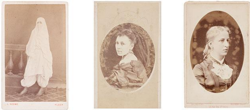
Gambar 2: Perubahan warna dan pemudaran pada gambar albumen print.

Percobaan teknis albumen print dalam penelitian ini menjadi penting dengan mengacu pada konteks (1) Pemahaman material historis untuk tujuan konservasi, (2) Pelestarian visual sebagai warisan budaya fotografi abad ke-19, (3) Pengembangan riset interdisipliner antara fotografi (seni), kimia, dan konservasi, dan (4) Pendidikan fotografi warisan masa lampau di institusi pendidikan seni.