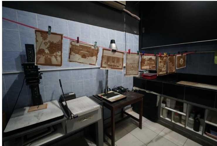
Gambar 5: Pengeringan hasil albumen print yang telah difiksasi serta dicuci bersih. (Dokumentasi penelitian)

memperkaya warna cetakan. Setelah toning, dilakukan fiksasi menggunakan sodium thiosulfate untuk menghilangkan sisa silver chloride sehingga gambar menjadi permanen. Proses ditutup dengan pencucian akhir menggunakan air mengalir selama kurang lebih 30 menit untuk memastikan sisa bahan kimia benar-benar hilang, kemudian kertas dikeringkan dan diratakan. Keseluruhan rangkaian proses ini menghasilkan albumen print dengan kualitas visual khas abad ke-19 serta stabilitas material yang dapat dianalisis lebih lanjut dalam konteks konservasi.