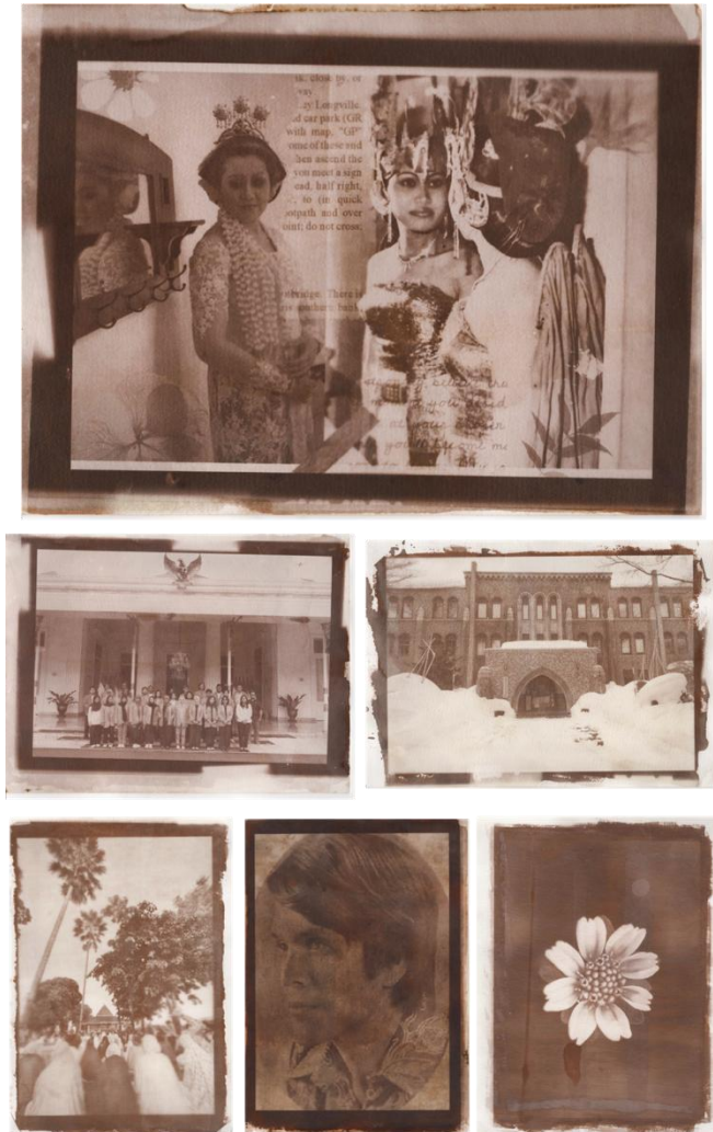
Gambar 6. Sampel albumen print hasil percobaan peserta workshop albumen print pada tanggal 12 Juli 2025

tonal yang sedikit menurun. Hal ini terjadi karena tingkat penyerapan air yang lebih tinggi, membuat permukaan kertas cepat mengembang dan berpotensi mempercepat degradasi lapisan albumen. Pada jangka panjang, kertas cellulose juga lebih rentan terhadap penguningan dan kerusakan akibat kondisi iklim tropis sehingga kurang ideal untuk proses konservasi.