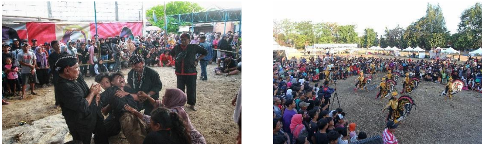
Gambar 1 dan 2:

ini ditujukan untuk menghibur dan menjadi sarana pemersatu masyarakat, terkadang juga melambangkan perlawanan terhadap penindasan.