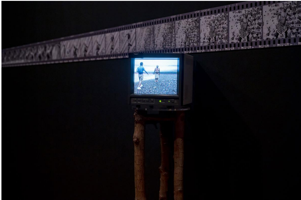
Gambar 3. Krisna Murti. 12 Hours in the Life of Agung Rai, the Dancer . 1993. Tampilan instalasi, National Gallery Singapore, 2024