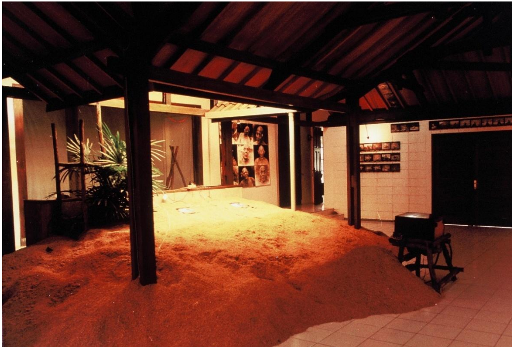
Gambar 2. Krisna Murti. 12 Hours in the Life of Agung Rai, the Dancer . 1993. Tampilan instalasi, Studio R66, Bandung, Indonesia, 1993