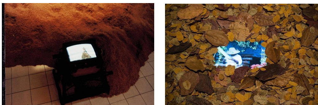
Gambar 5. Krisna Murti.. 1993. Tampilan

Site-responsiveness menjadi aspek penting dalam karya ini. Pilihan material lokal seperti sekam padi di Indonesia dan daun kering di Singapura menggambarkan bagaimana karya ini beradaptasi dengan lokasi tempat pameran. Konsep site-specific di sini bukan hanya tentang material fisik, tetapi juga tentang cara karya menghubungkan dirinya dengan konteks budaya dan ekosistem yang ada. Material alami yang digunakan di ruang pameran tidak hanya berfungsi sebagai elemen estetika, tetapi juga sebagai simbol hubungan antara manusia dan alam. Hal ini menggarisbawahi pentingnya konteks dalam seni kontemporer. Karya ini mengajak penonton untuk merasakan hubungan yang lebih mendalam dengan tempat dan budaya di sekitar mereka, memperkenalkan perspektif tentang bagaimana materialitas lokal dapat mengungkapkan makna yang lebih kaya dan terhubung dengan nilai tradisi.