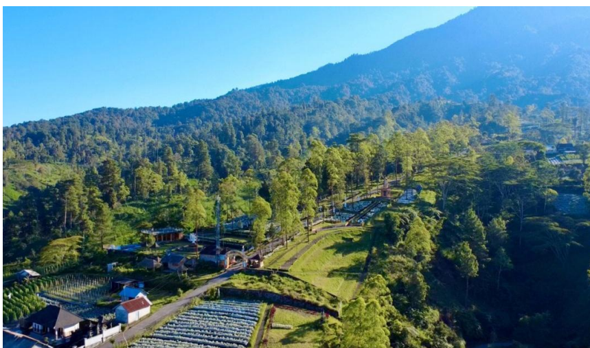
Gambar 1 Taman Edelweis tampak atas

Petikan narasi di atas menunjukkan benda mati berupa semesta, pertiwi, dan langit digambarkan seperti makhluk hidup yang mampu “menyuguhkan”, “membisikan”, “membasuh”, dan “mendepak”. Semesta yang membisikan puisi adalah bentuk kehangatan dan keagungan yang digambarkan dalam bentuk narasi yang diperkuat dengan visual menawan. Lengan langitnya mendepak lelap dapat dilihat sebagai sebuah simbol ketenangan yang ditawarkan langit Taman Edelweis seperti gambar di bawah ini.